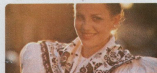
Informace o dění v obci